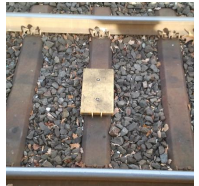
Streckenelement in ETCS: Die Eurobalise übermittelt bis zu 1023 BIT an Streckeninformationen an das Fahrzeug.